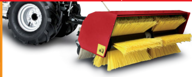
Spazzolatrice professionale orientabile lateralmente (accessorio) Ruota 16x6.50 - 8 (necessita distanziale 60mm) (accessorio) Professional rotary sweeper side adjustable (implement) Tyre 16x6.50 - 8 Requires wheel spacers mm 60 (implement)