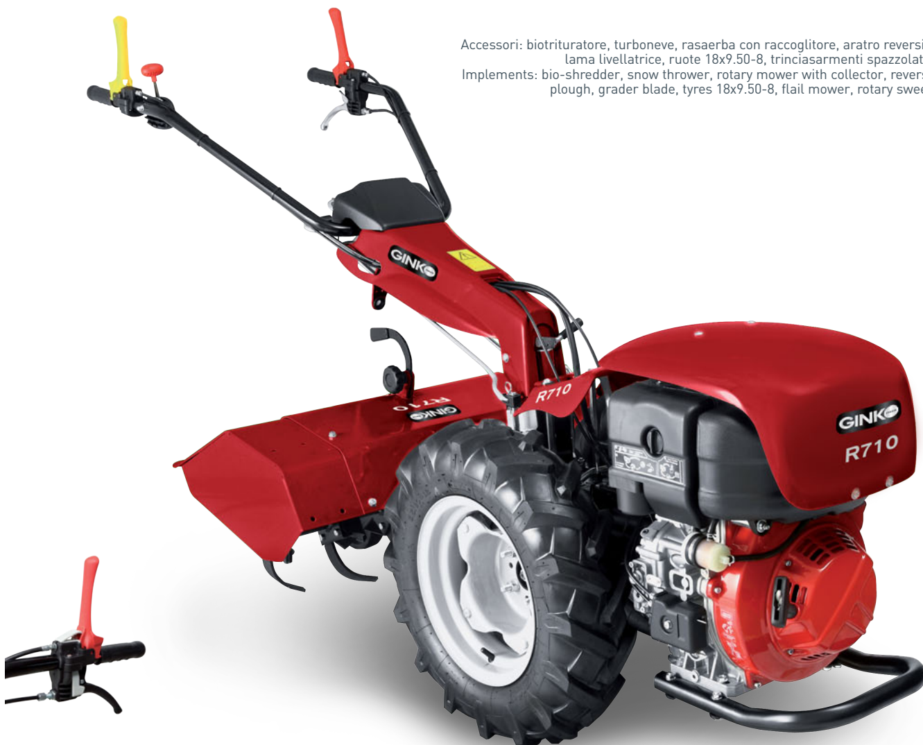
Doppio comando frizione hold-to-run Hold-to-run double clutch lever

Accessori: biotrituratore, turboneve, rasaerba con raccogliore, aratro reversibile, lama livellatrice, ruote 18x9.50-8, trinciasarmenti spazzolatrice. Implements: bio-shredder, snow thrower, rotary mower with collector, reversible plough, grader blade, tyres 18x9.50-8, flail mower, rotary sweeper.