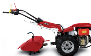
Attacco rapido per accessori (accessorio) Quick coupling for implements (implement)