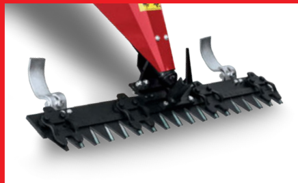
Falciatrice (accessorio) Sickle bar (implement)