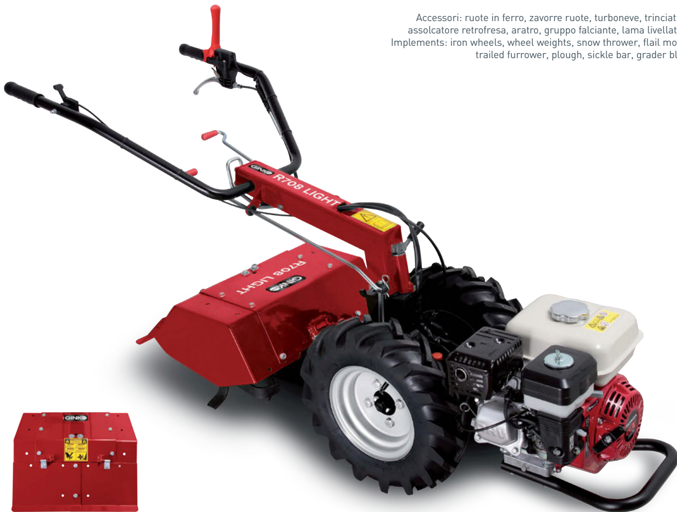
Fresa registrabile da 60cm a 40cm (accessorio) Tiller adjustable from 60cm to 40cm (implement)

Accessori: ruote in ferro, zavorre ruote, turboneve, trinciatutto, assolcatore retrofresa, aratro, gruppo falciante, lama livellatrice. Implements: iron wheels, wheel weights, snow thrower, flail mower, trailed furrower, plough, sickle bar, grader blade.