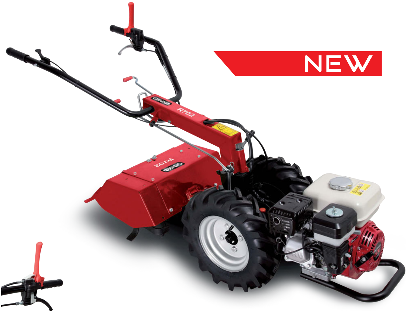
Doppio comando frizione hold-to-run Hold-to-run double clutch lever