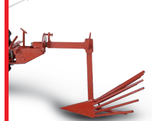
Barra portattrezzi (accessorio) Scava patate (accessorio) Too bar (implement) Potato lifter (implement)