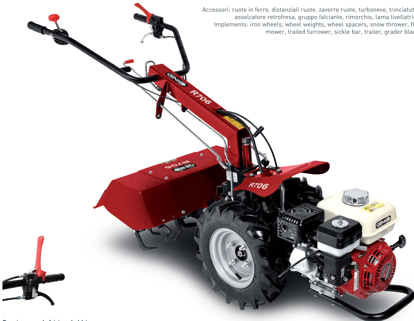
Doppio comando frizione hold-to-run Hold-to-run double clutch lever

Accessori: ruote in ferro, distanziali ruote, zavorre ruote, turboneve, trinciatutto, assolcatore retrofresa, gruppo falciante, rimorchio, lama livellatrice. Implements: iron wheels, wheel weights, wheel spacers, snow thrower, flail mower, trailed furrower, sickle bar, trailer, grader blade.