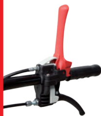
Doppio comando frizione hold-to-run Hold-to-run double clutch lever