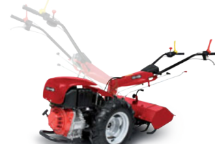
Stegole reversibili orientabili in altezza e lateralmente Height and side adjustable reversible linkage