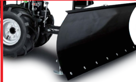
Lama livellatrice cm 85 orientabile lateralmente (accessorio) 85 cm side adjustable Grader blade (implement)