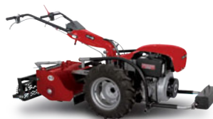
Fresa interrassasi con zavorra (accessorio) Stone burier (implement)