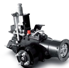
Gruppo cambio in ghisa Cast iron gear unit