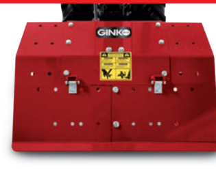
Fresa registrabile da 60cm a 40cm Tiller adjustable from 60cm to 40cm