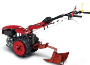
Assolcatore professionale (accessorio) Professional furrower (implement)