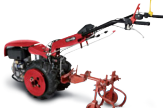
Estirpatore (accessorio) Zavorra Ruota Kg50 (accessorio) Adjustable cultivator (implement) Wheel weights Kg 50 (implement)