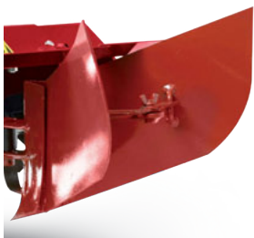
Assolcatore retrofresa (accessorio) Trailed furrower (implement)