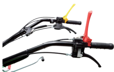
Comandi ergonomici centralizzati Ergonomic controls