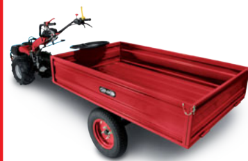
Rimorchio ribaltabile con freni (accessorio) Tip-up trailer with brakes (implement)