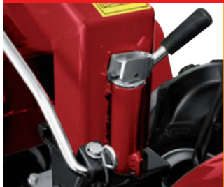
Dispositivo rapido orientamento stegole Quick linkage adjustment device