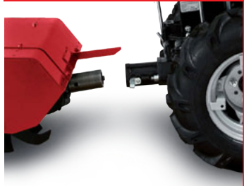
Attacco rapido per accessori Quick coupling for implements