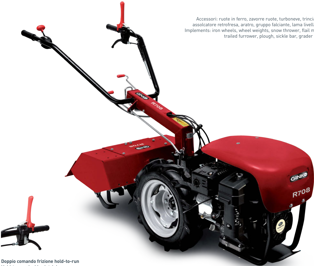
Doppio comando frizione hold-to-run Hold-to-run double clutch lever

Accessori: ruote in ferro, zavorre ruote, turboneve, trinciatutto, assolcatore retrofresa, aratro, gruppo falciante, lama livellatrice. Implements: iron wheels, wheel weights, snow thrower, flail mower, trailed furrower, plough, sickle bar, grader blade.