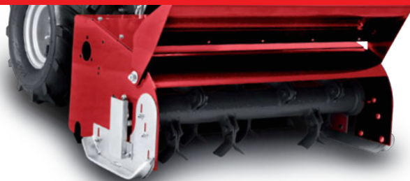
Trinciatutto TR60 (accessorio) TR60 flail mower (implement)