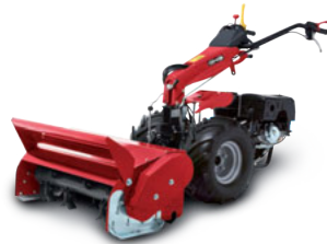
Trinciatutto TR80 (accessorio) TR80 flail mower (implement)