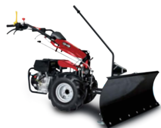
Lama livellatrice cm120 orientabile lateralmente (accessorio) 120 cm side adjustable Grader blade (implement)