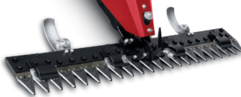
Falciatrici professionali con cofano in movimento (accessorio) Professional cutter with moving hood (implement)