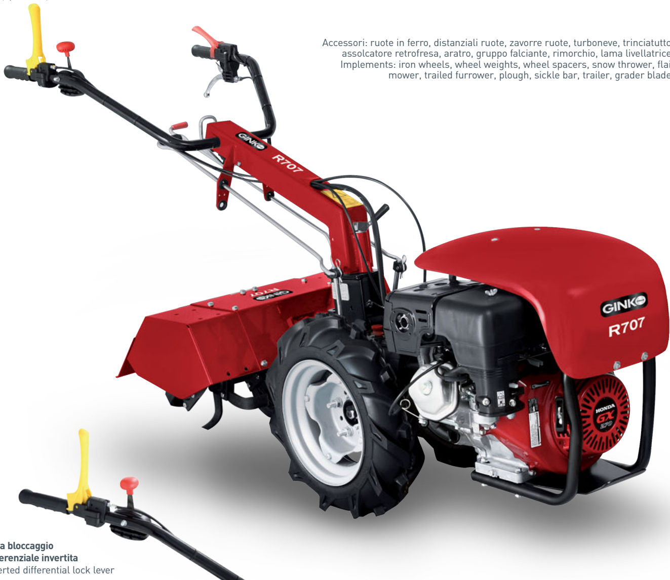
Leva bloccaggio differenziale invertita Inverted differential lock lever

Accessori: ruote in ferro, distanziali ruote, zavorre ruote, turboneve, trinciatutto, assolcatore retrofresa, aratro, gruppo falciante, rimorchio, lama livellatrice. Implements: iron wheels, wheel weights, wheel spacers, snow thrower, flail mower, trailed furrower, plough, sickle bar, trailer, grader blade.