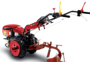
Aratro reversibile (accessorio) Reversible plough (implement)