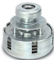
Frizione antistress Anti-stress clutch