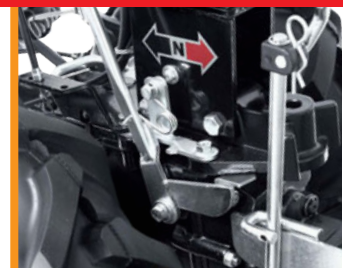
Inversore rapido Quick inverter